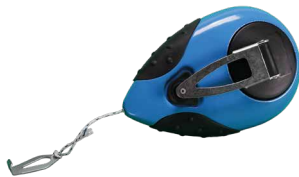
ARTIKELNUMMERN UND ABMESSUNGEN

SCHLAGSchnurGerät Mit Alu-GeHäUSe - Schnelles aufwickselsystem