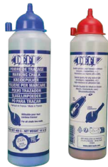
ARTIKELNUMMERN UND ABMESSUNGEN