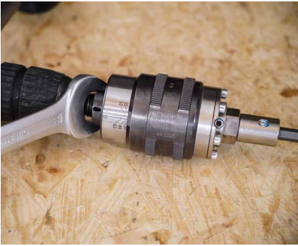
Régler le TORQUE LIMITER sur la bonne valeur de couple.