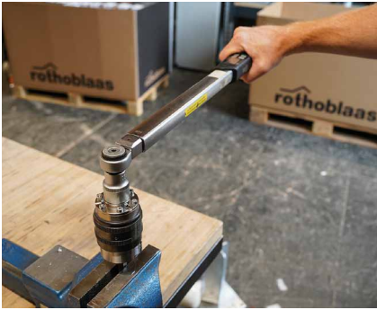
Effectuer un contrôle initial du couple avec une clé dynamométrique.