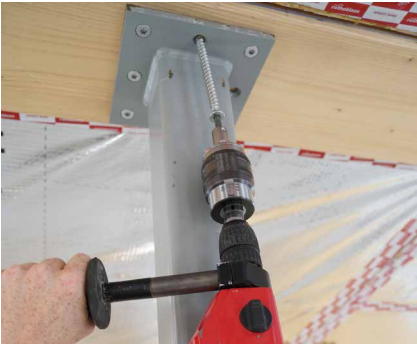
Durant le vissage, le TORQUE LIMITER se débraye à la valeur de couple définie.