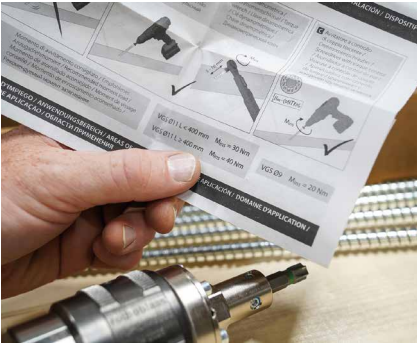
Vérifier avec précision la valeur limite de couple prévu pour la vis.

Lire le manuel d'utilisation du TORQUE LIMITER avant l'utilisation. Inclus avec le produit et disponible sur www.rothoblaas.fr .