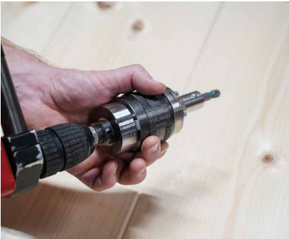
Tourner le manchon externe pour réinitialiser le TORQUE LIMITER.