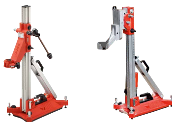
BS 160 | BS 320 B pág. 222