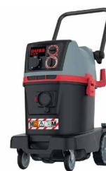
DUHXA pág. 249